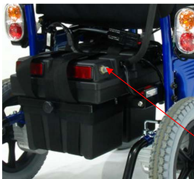
Pulsante di ripristino

L'interruttore di circuito è un pulsante di ripristino posto sulla scatola della batteria con 2 connettori. L'interruttore di circuito monitorizza la corrente elettrica prelevata dalle batterie. È una funzione incorporata nella carrozzina elettrica per garantire una maggiore sicurezza. Quando le batterie e i motori sono sollecitati pesantemente, l'interruttore di circuito scatta per prevenire danni ai motori e ai componenti elettronici. Se l'interruttore di circuito scatta, attendere circa un minuto e quindi premere il pulsante per il ripristino. Quindi accendere l'alimentazione della centralina e continuare il normale uso. Se l'interruttore di circuito continua a scattare, contattare il rivenditore autorizzato.